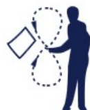
Drapeau agité en 8