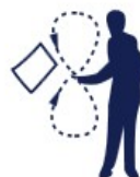
Drapeau agité en 8