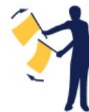
Double drapeau jaune agité